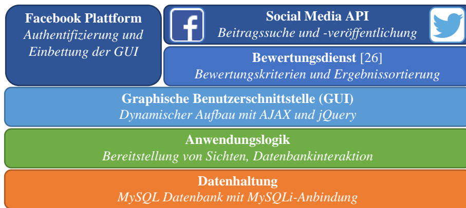
Abb. 1. Architektur der crossmedialen Facebook-Applikation

gen abgeleitet, die zur Überprüfung von C4 notwendig sind. Daher soll die Applikation den Benutzer dahingehend unterstützen, die nach seinem Ermessen wichtigen Informationen zu konfigurieren und anzuzeigen.