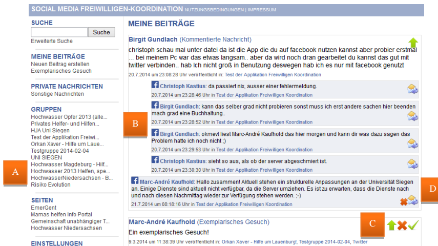
Abb. 2. In Facebook eingebettete crossmediale Applikation mit Beitragsübersicht

Das implementierte Dashboard (Abb. 2) bietet dem Benutzer eine Übersicht über seine veröffentlichten Beiträge und stellt die Gruppen, in denen er Mitglied ist, und Seiten, die er „geliked“ hat, dar (A). Es stellt zusätzlich alle Beiträge mitsamt der Kommentare chronologisch dar, die der Benutzer innerhalb oder außerhalb der Applikation erzeugt oder kommentiert hat (B).