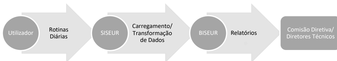
Figura 2 - Integração do BISEUR no SISEUR

O PO SEUR tem implementado um Sistema de Informação (SISEUR) que tem como objetivo a gestão de informação referente a projetos candidatos e aprovados a financiamento através do PO SEUR. O sistema corre em ambiente Web através do browser e permite a realização de operações de introdução, alteração, remoção e pesquisa. A integração do BISEUR com o SISEUR será da seguinte forma: