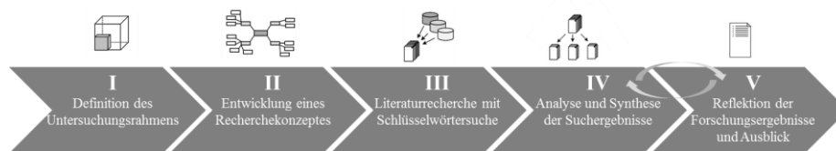
Abb. 1. Rahmenkonzept für Literaturanalysen (in Anlehnung an [13], [14])

Da die Forschungsfragen auf den gegenwärtigen Einsatz von Informationssystemen und die dazu eingesetzten Methoden abzielen, gilt die Literaturanalyse als geeignete Forschungsmethode [11]. Um Anforderungen an eine methodisch saubere und wissenschaftlich angemessene Arbeitsweise bei Literaturanalysen zu erfüllen, wird nach dem Rahmenkonzept von VOM BROCKE et al. [13] vorgegangen, das in Abb. 1 dargestellt ist.